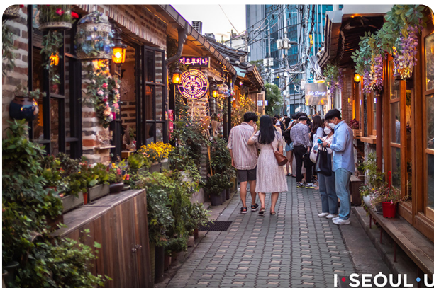
Ikseongdong Hanok Village