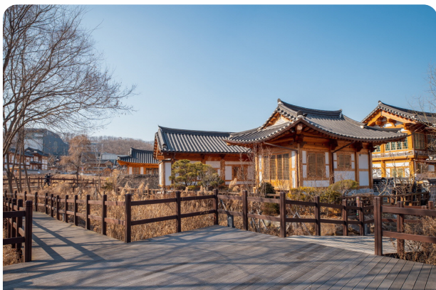
Eunpyeong Hanok Village