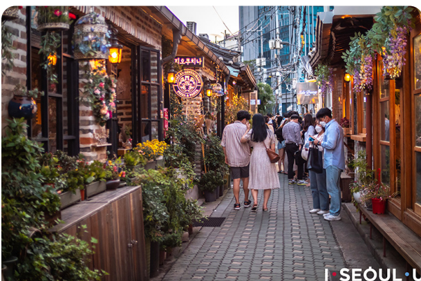
Ikseongdong Hanok Village