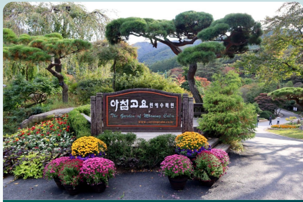
Garden of Morning Calm