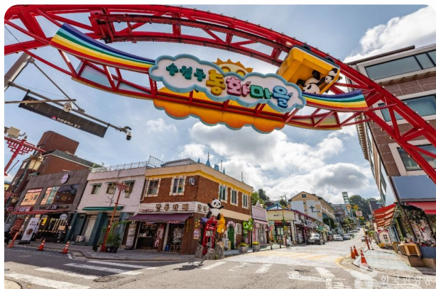
Songwoldong Fairy Tales Village